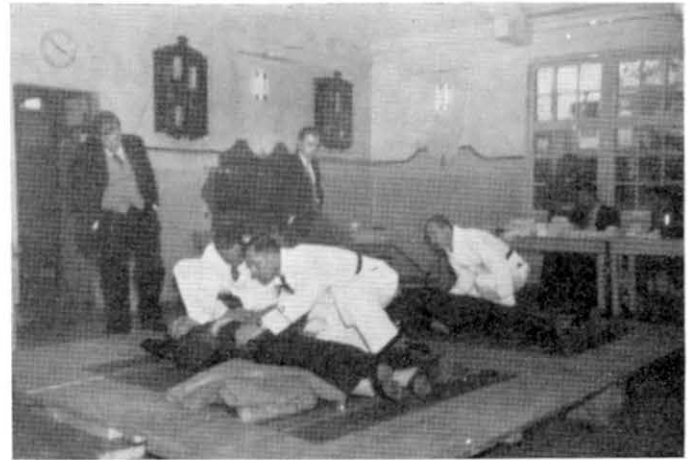
De drie E.H.B.O.-ers van ons bedrijf bij het uitvoeren van de lang niet gemakkelijke opgave.

Dat dit begrepen werd lieten achtereenvolgens de ploegen van de N.K.F. te Alblasserdam, „De Klop” te Sliedrecht, „Holland” van Hardinxveld-Giessendam, „De Merwede”, de Meterfabriek Dordrecht, E.M.F. Dordrecht en Betondak te Arkel zien, uiteraard onder het kritische oog van drie doktoren die zitting hadden genomen in de jury.